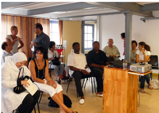
Hierzu einige Stellungnahmen der Initiative Haus der Kulturen – Braunschweig sowie Beispiele geplanter Integrationsprojekte (Seite2).

Seit 2008 wird erneut über ein Haus für Integrations- und Migrationsarbeit verstärkt diskutiert. So trafen sich ca. 50 Vertreter/innen von MSO'en unterschiedlichster Nationalitäten, der Verwaltung, des Ausschusses für Integrationsfragen und des Rates mehrmals in einem öffentlich ausgeschriebenen Beteiligungsprozess, um sich auszutauschen. Abschließend wurde dem Rat ein Rahmenkonzept für ein Haus der Kulturen vorgelegt.